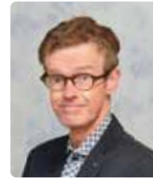
Vincent Bos Communicatie