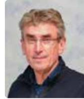
Gerie Driessen Gebouwen